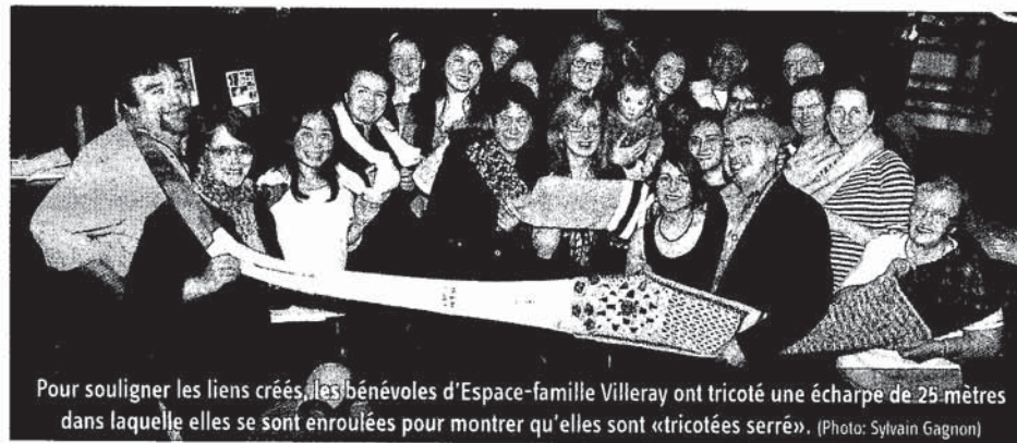
Pour souligner les liens créés, les bénévoles d'Espace-famille Villeray ont tricoté une écharpe de 25 mètres dans laquelle elles se sont enroulées pour montrer qu'elles sont «tricotées serré».

Au cours des années, Espace-famille Villeray a eu un impact dans la vie du quartier et dans